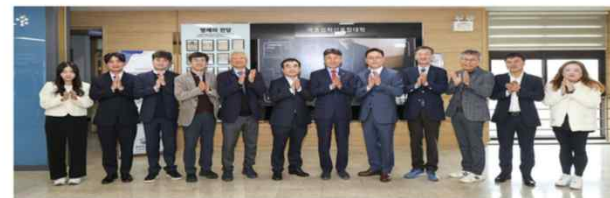
영남대 에코업혁신융합대학사업단, 스마트미팅존 개소 *재향매 및 DB 금지

[경산=뉴스시스] 박준 기자 = 영남대학교는 에코업혁신융합대학사업단 스마트미팅존의 문을 열고 청단 교육실현 및 지·산·학 협력 강화를 위한 기반 마련에 나선다고 7일 밝혔다.