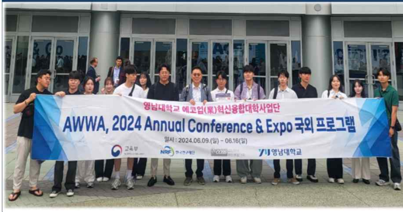
AWWA ACE 2024